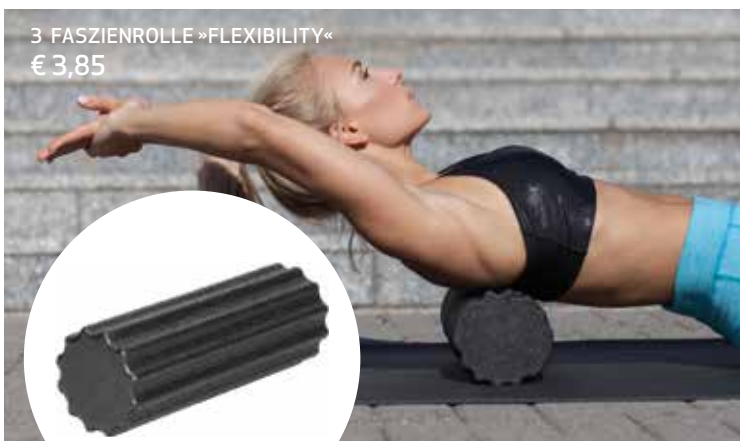
3 FASZIENROLLE »FLEXIBILITY« € 3,85