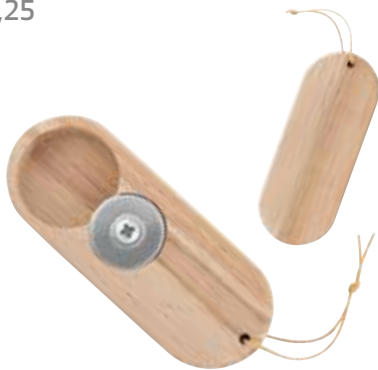
1 FLASCHENÖFFNER »WOODY« € 3,25