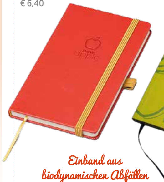
5 NEWAPPLE NOTIZBUCH MIT BLINDPRÄGUNG € 6,40