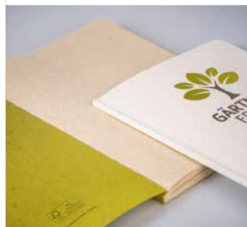
5 BUCHKALENDER »SLIMLINE« € 3,35