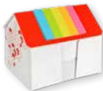
5 KARTONBOX HAUS »10« € 4,75