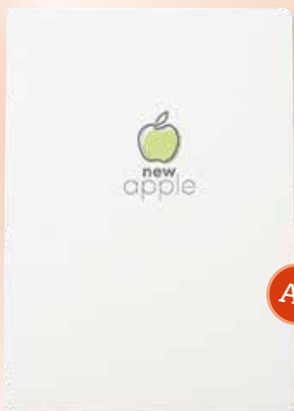
4 NEWAPPLE NOTIZBUCH FLEX A5 PRINT € 3,80