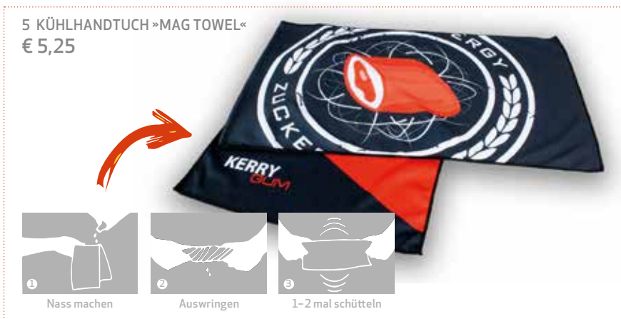
5 KÜHLHANDTUCH »MAG TOWEL« € 5,25