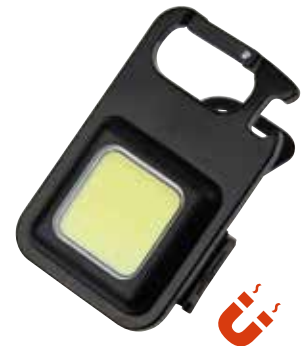
5 MINI-WORKLIGHT 150 MAH € 3,95