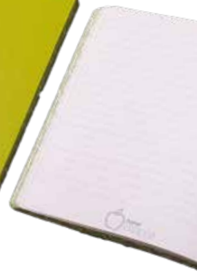
6 NEWAPPLE NOTIZBUCH FLEX IM APP-FORMAT € 6,75