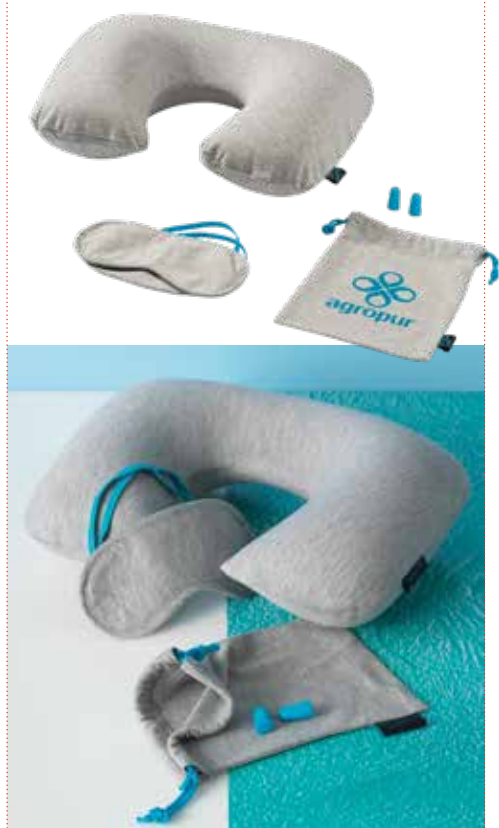
1 REISESET »MIAMI« € 6,75