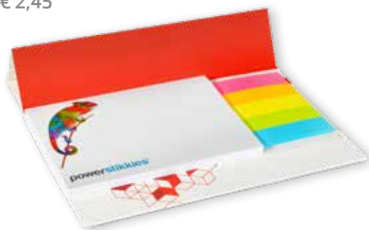
4 HAFTSET DESKPAD »25« € 2,45