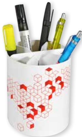
2 OFFICE ORGANIZER »03« € 6,00