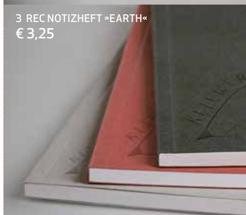
3 REC NOTIZHEFT »EARTH« € 3,25