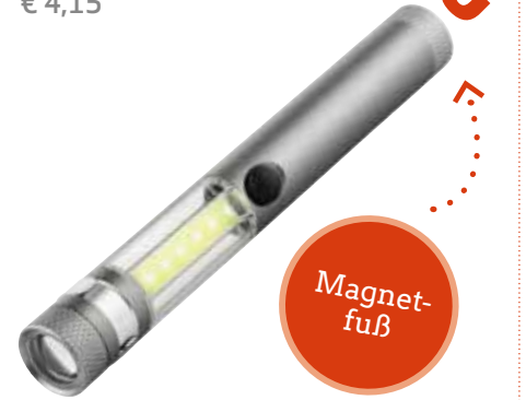
3 WORKLIGHT »MIDI COB« € 4,15

Preiswerte Worklight mit Eco-Watt-LED Frontscheinwerfer und COB Arbeitslicht. COB Technologie, spritzwasser-/überspannungsgeschützt. Magnetfuß, Clip, 3 AAA Batterien. Material: Kunststoff / Metall. Farbe: schwarz. Maße: 16,8 x 2,2 x 2,6 cm. Verpackung: Designkarton. Preis ab 100 St. Best.-Nr. 232032 € 3,25