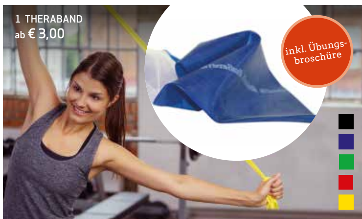
1 THERABAND ab € 3,00