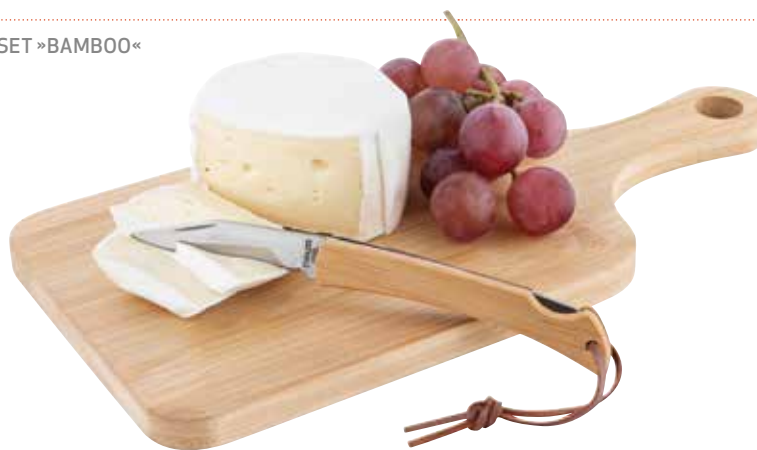
2 BROTZEIT SET »BAMBOO« € 5,45