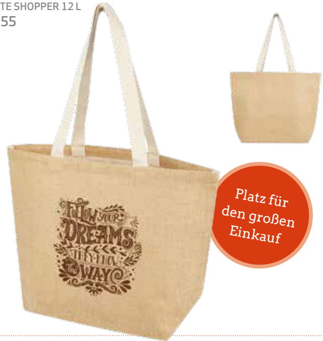
2 JUTE SHOPPER 12 L € 2,55