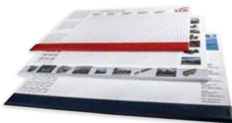
Einzelblattdruck oder Druck auf PVC- Leiste möglich