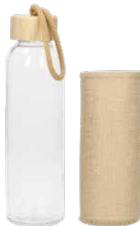
7 GLASTRINKFLASCHE »GO ECO« € 3,30