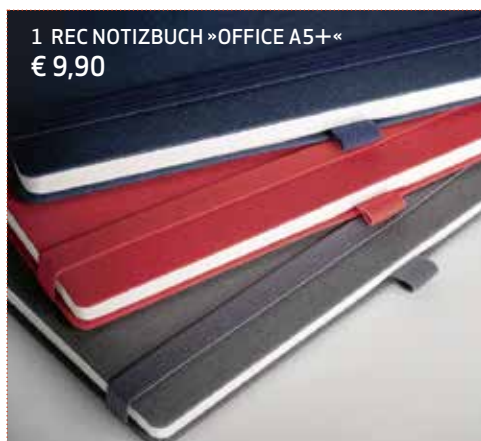
1 REC NOTIZBUCH »OFFICE A5+« € 9,90