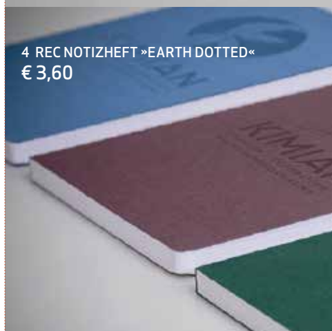
4 REC NOTIZHEFT »EARTH DOTTED« € 3,60