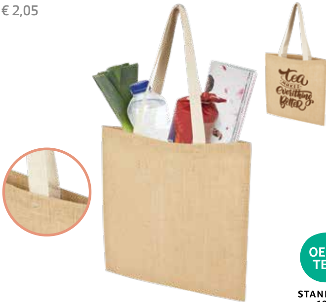
1 JUTE TRAGETASCHE 7 L € 2,05