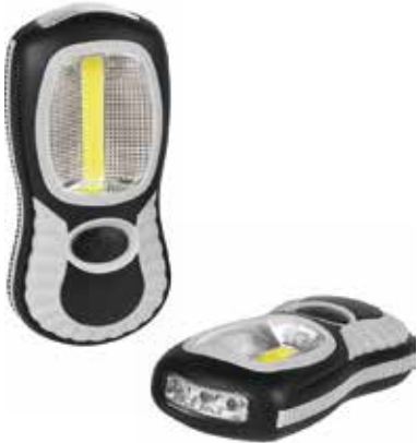
1 LED LEUCHE »OVAL LIGHT M 230 L« € 5,50