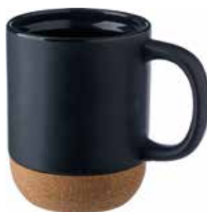
4 KERAMIKBECHER »ROSAMUND« € 3,50