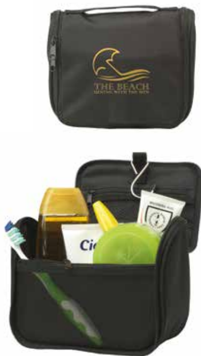
2 KULTURBEUTEL »SMART« € 5,45