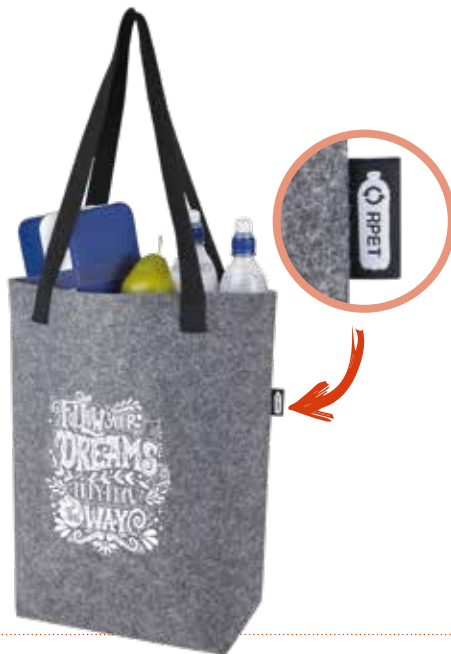
3 FILZTRAGETASCHE »GRS-REC« 12 L € 3,10