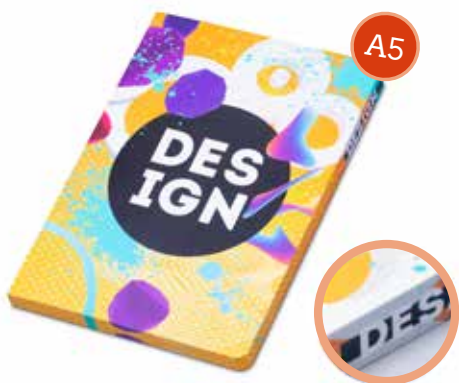
1 DESIGN NOTIZBUCH FLEX A5 € 5,20